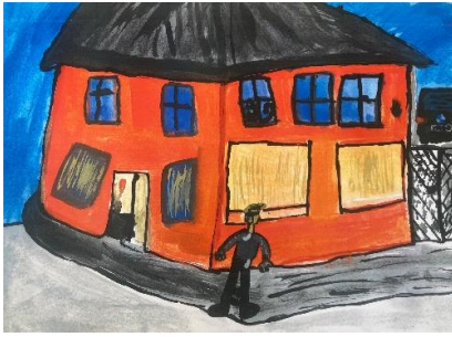
5. třída - 2. místo a 3. místo