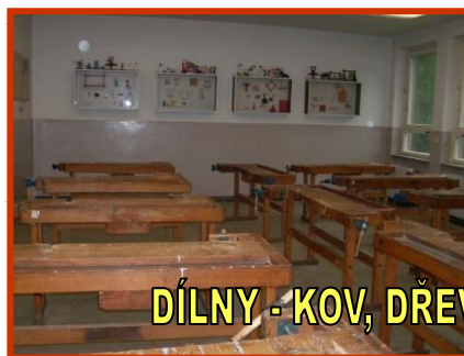
DÍLNY - KOV, DŘEVO, PLASTY